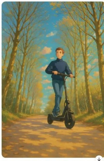
Hier is je afbeelding in Studio Ghibli-stijl! 😊